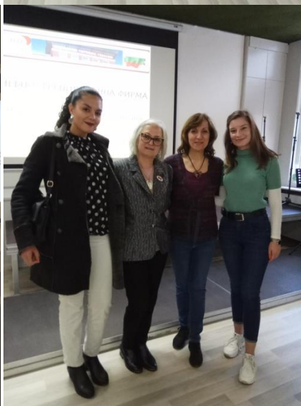
Изготвил: Недка Миленова - гл. учител ПО в Националната търговска гимназия – Пловдив